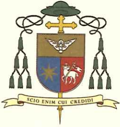
SALVADOR CRISTAU COLL OBISPO DE TERRASSA